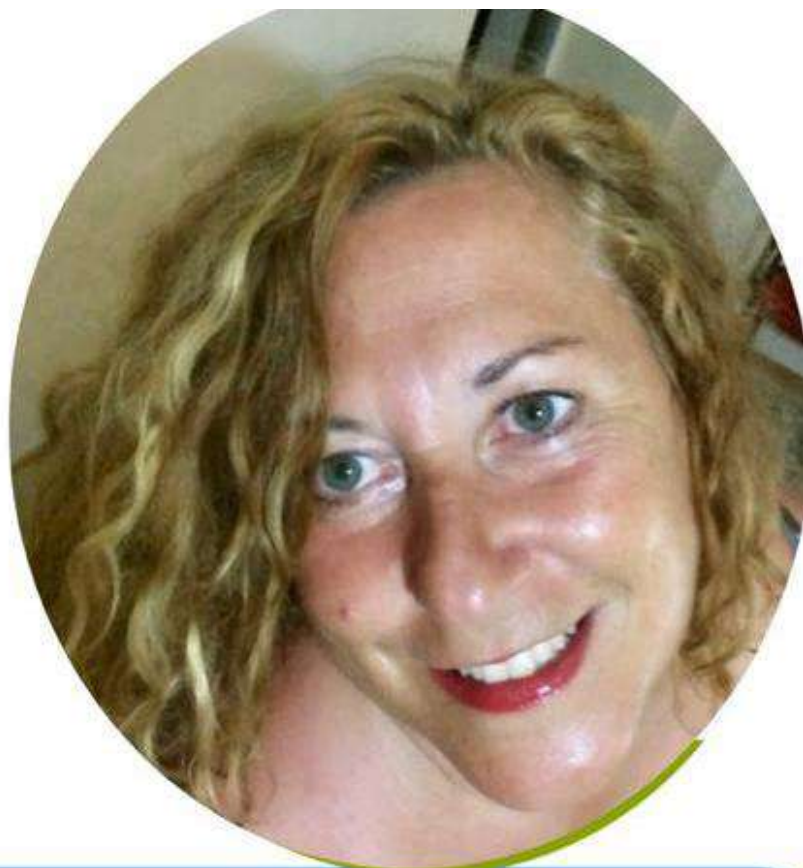
EMILIA MEZZATESTA SCUOLA PRIMARIA

Ho accettato di candidarmi in questa lista perché credo nelle cose umili, ho sempre lottato per il riscatto sociale e la dignità della persona, promuovendone la crescita personale e sociale. Conosco il mondo della scuola paritaria, della scuola pubblica e della cooperazione sociale. Ogni giorno della mia vita dal 1990 l'ho vissuto educando, empatizzando con alunni, colleghi, famiglie, associazioni. Ritengo che la nostra presenza nel mondo del sindacato dei "Grandi" possa fare la differenza. Se sei sfiduciato/a e non ti senti ascoltato/a sappi che tanti docenti sono nella tua stessa condizione. Fai un passo di fiducia, aiutaci a riappropriarci della dignità del ruolo, ormai perso nel tempo.