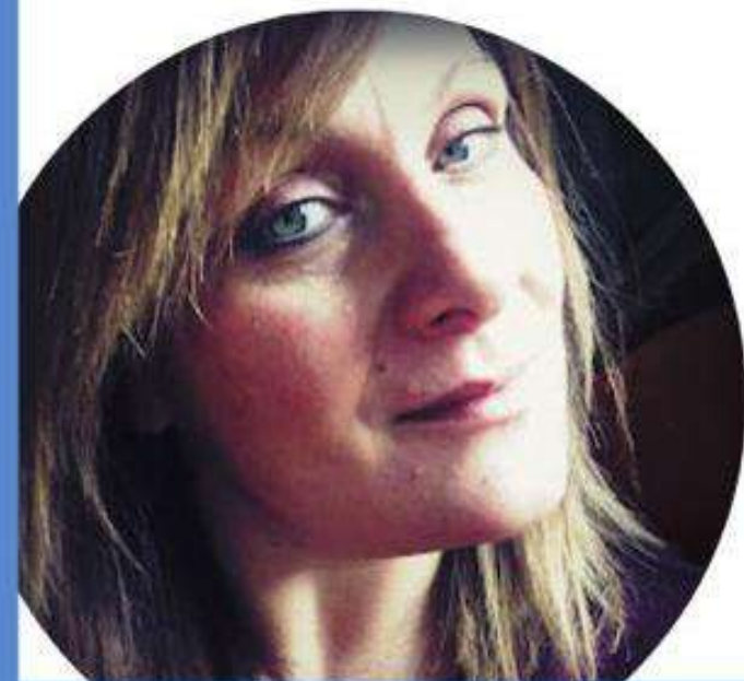
NADIA TAVELLA SCUOLA SECONDARIA DI PRIMO GRADO

Il nostro scopo come lista sarà quello di portare una fotografia attendibile della realtà, e rappresentare al meglio tutto il comparto scuola. Bisogna ridare dignità alla figura docente perchè siamo i primi agenti di inclusione sociale ed educativa.