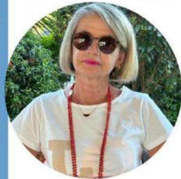
Michela Acconci Scuola Primaria

Ecco il perché della mia candidatura e la scelta di questo Sindacato che ha fatto proprie le lotte per una SCUOLA DEMOCRATICA, LIBERA che sappia dare dignità' alla professione degli insegnanti e che passi anche da una " giusta" riqualificazione economica.