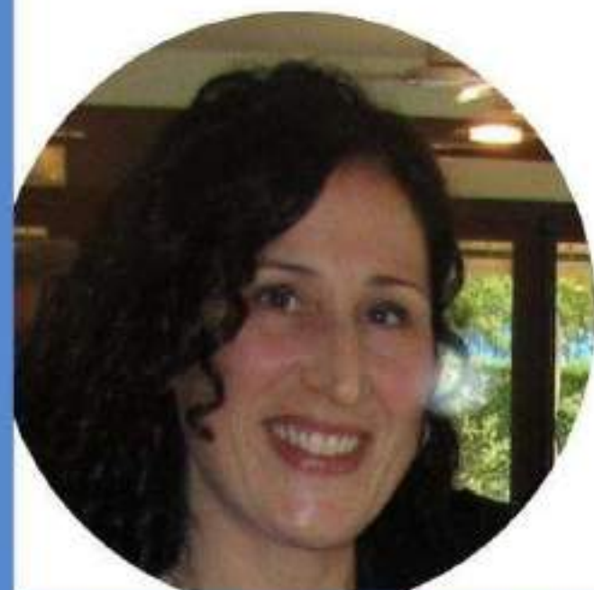
GIOVANNA TESTA SCUOLA PRIMARIA

Credo che il CSPI possa essere uno strumento per dare voce ai docenti e per costruire una scuola migliore per tutti. Se anche tu credi in questi valori vota per me, vota la lista "NOI SCUOLA BENE COMUNE"!