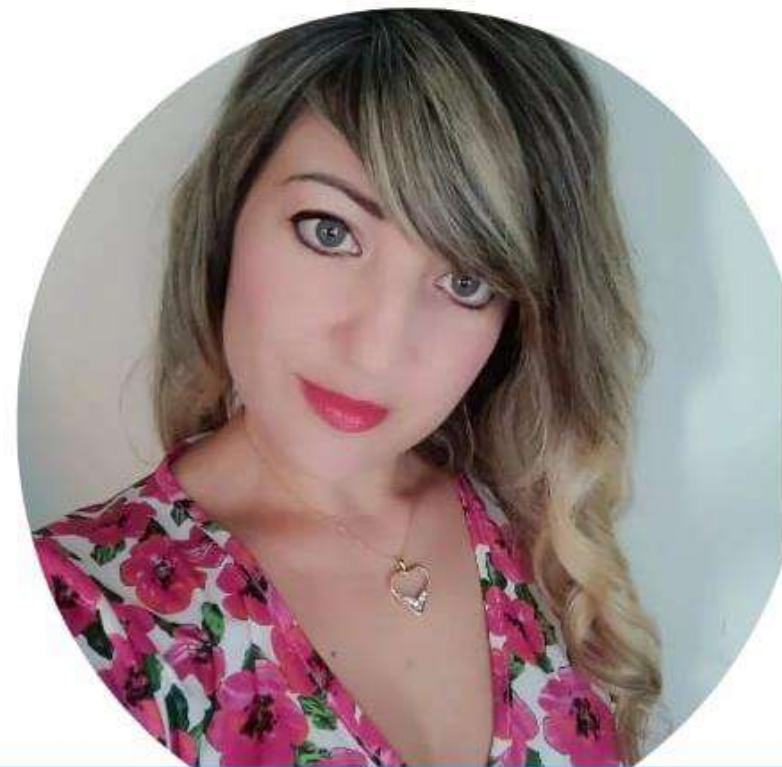
Vanessa Acri Scuola Primaria

Voglio una scuola ove integrazione e inclusione non siano solo belle parole sulla carta ma qualcosa di reale e concreto. Voglio che i docenti si sentano motivati nel loro lavoro perché adeguatamente riconosciuto nella sua dignità e adeguatamente remunerato. Voglio docenti con la voglia di portare i bambini in gita perché lo Stato gli riconosce la trasferta e li tutela giuridicamente. Voglio una scuola che abbia ambienti idonei all'apprendimento e con i giusti strumenti e non tanti fondi investiti male a causa dei troppi vincoli imposti. Insieme possiamo! Scegli NoiScuola Bene Comune.