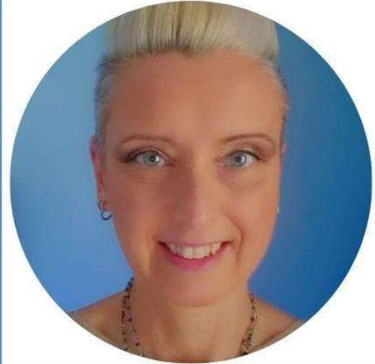
MARTA ERODIANI SCUOLA PRIMARIA

Sono fermamente convinta che la scuola sia un luogo di crescita fondamentale per gli studenti e che il benessere di tutti i componenti della comunità scolastica sia un prerequisito per il successo formativo. Per questo, se eletta al CSPI, mi impegnerò con tenacia e passione a rappresentare gli interessi di tutti, lavorando per un sistema scolastico sempre più inclusivo, equo ed efficiente."