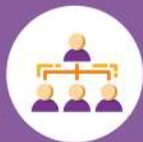
FIGURE E FUNZIONI ORGANIZZATIVE